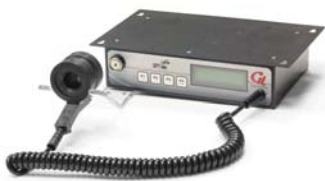
Boîtier robuste, façade intégrée