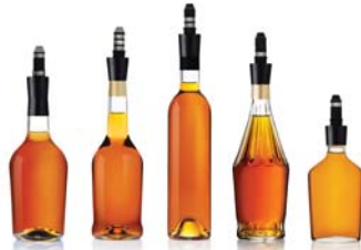
Protège tout votre inventaire