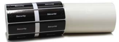
Sceaux de sécurité réguliers